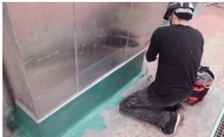
既存シーリング撤去中