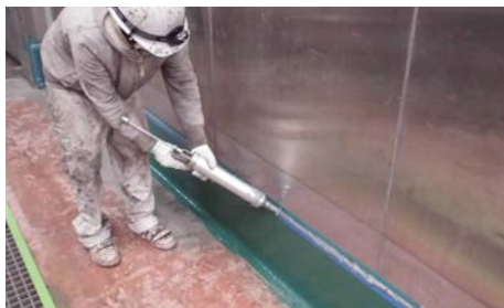
新設シーリング充填中