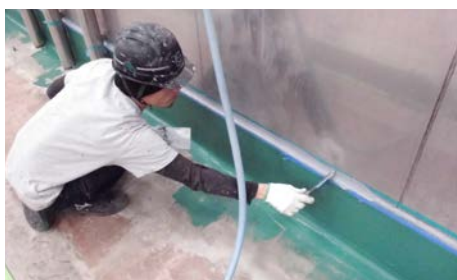
新設シーリング仕上中